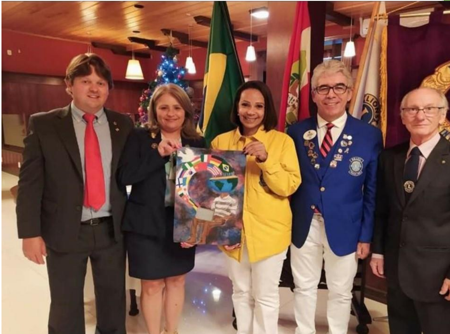
Escolha do Cartaz da Paz